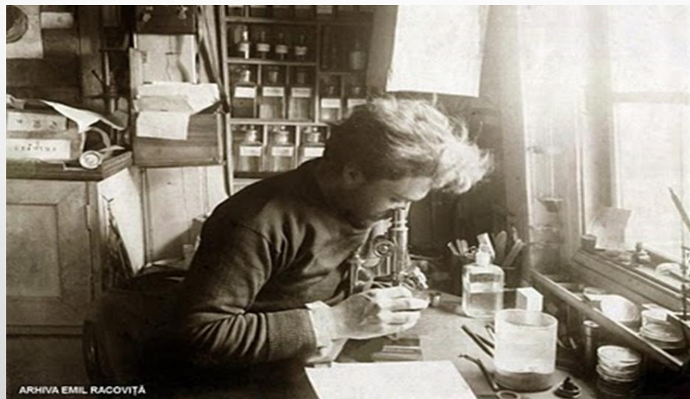
EMIL RACOVIȚĂ ÎN LABORATORUL AMENAJAT LA BORDUL VASULUI „BELGICA”

A FOST ALES CA NATURALIST AL EXPEDIȚIEI ANTARCTICE BELGIENE LA BORDUL NAVEI "BELGICA", ÎN ANTARCTICA, ÎNTRE ANII 1897-1899, EXPEDIȚIE CONDUSĂ DE ADRIEN DE GERLACHE. PENTRU EMIL RACOVIȚĂ, EXPEDIȚIA A CONSTITUIT UN EXTRAORDINAR PRILEJ DE A-ȘI LĂRGI ORIZONTURILE, RĂMÂNÂND ÎN ISTORIA MARILOR EXPLORATORI.