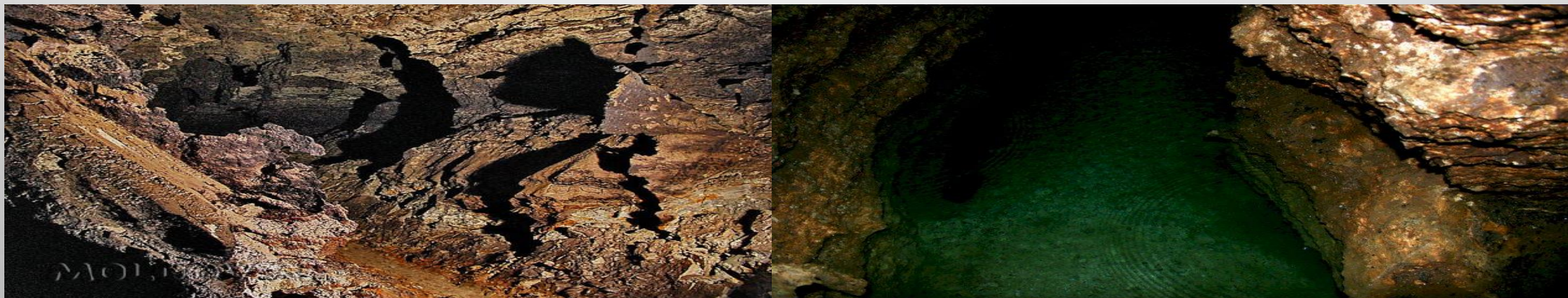
PEȘTERA EMIL RACoviȚĂ

EMIL RACoviȚĂ, ÎMPREUNĂ CU ALȚI CERCETĂTORI, A EXPLORAT APROAPE DOUĂ MII DE PEȘTERI DIN TOATE PĂRȚILE GLOBULUI, PUNÂND BAZELE SPEOLOGIEI, “ISTORIA NATURALĂ A DOMENIULUI SUBTERAN”. ÎN 1907, PUBLICA “ ESSAI SUR LES PROBLEMES BIOSPEOLOGIQUES ”, PRIMA LUCRARE IMPORTANTĂ DEDICATĂ BIOSPEOLOGIEI DIN LUME. DUPĂ ACEEA, A INIȚIAT UN PROGRAM INTERNAȚIONAL DE CERCETARE NUMIT “BIOSPEOLOGICA” CARE SĂ STUDIEZE FAUNA PEȘTERILOR, LA ÎNCEPUT CA O ACTIVITATE PRIVATĂ. ÎN 1919, BILANȚUL INSTITUȚIEI ERA URMĂTORUL: CERCETĂTORII EXPLORASERĂ 800 DE CAVITĂȚI SUBTERANE, COLECTASERĂ 20.000 DE ANIMALE ȘI PUBLICASERĂ 41 DE LUCRĂRI ȘTIINȚIFICE.