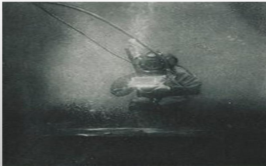
EMIL RACOVIȚĂ SCAFANDRU LA BANYULS-SUR-MER ÎN IARNA 1899

ÎN TIMPUL EXPEDIȚIEI DIN ANTARCTICA, EMIL RACOVIȚĂ A AVUT POSIBILITATEA SĂ STUDIEZE VIAȚA IMENSELOR MAMIFERE ACVATICE, DAR ȘI A PINGUINILOR. ÎN ISTORIA ȘTIINȚELOR NATURII, EMIL RACOVIȚĂ ESTE CONSIDERAT PĂRINTELE BALENEI CU CIOC, FIIND PRIMUL CARE A STUDIAT-O, A FOTOGRAFIAT-O ȘI A DESCRIES-O ÎN CELE MAI MICI AMĂNUNTE.